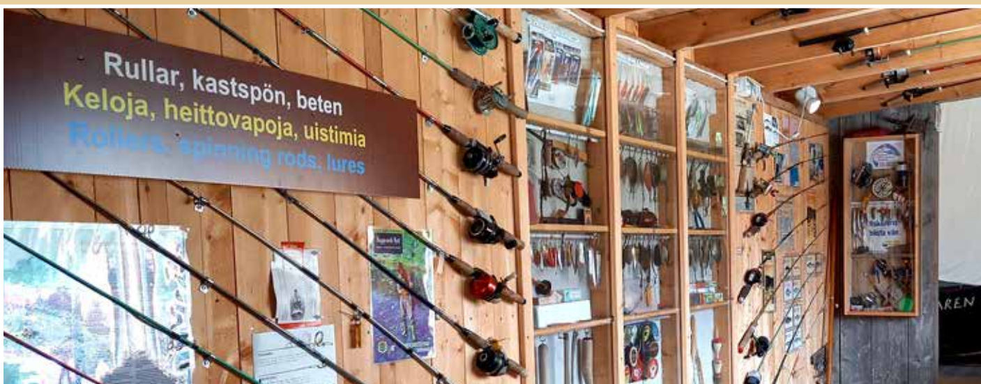
Utställningen ovan sammanställd av Bror Antus. Färgbilder, layout: Göran Strömfors