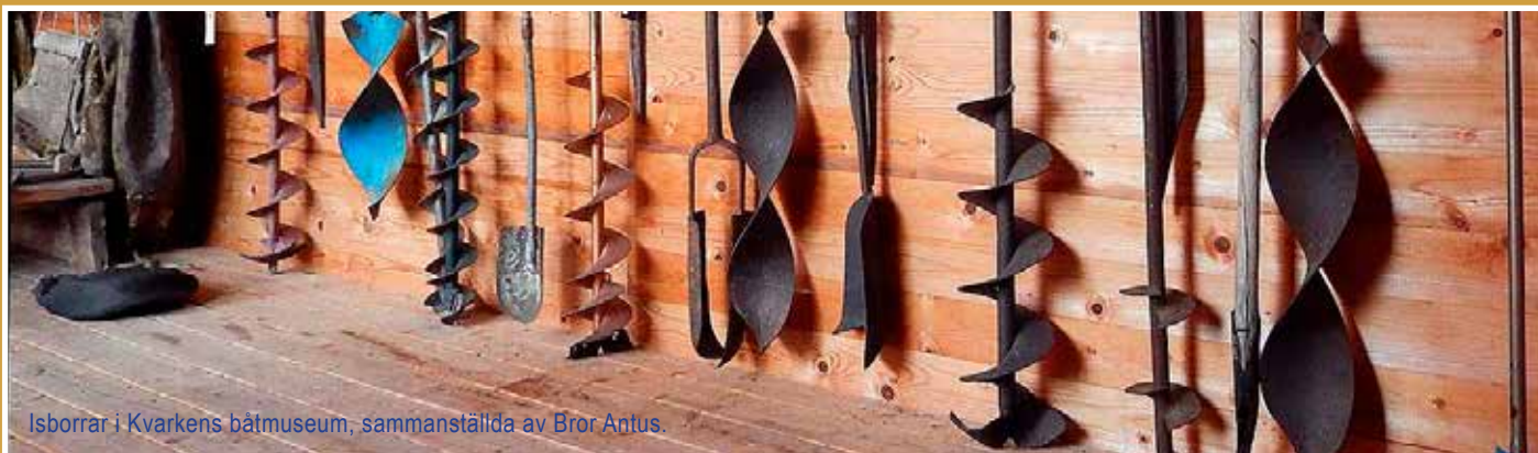
Isborrar i Kvarkens båtmuseum, sammanställda av Bror Antus.