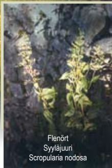
Flenört Sylläjuuri Scropularia nodosa