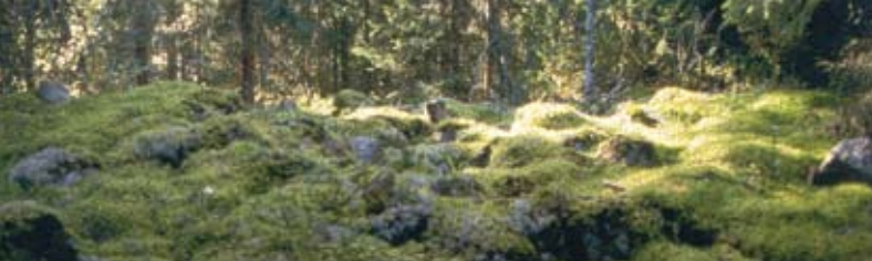
Gravröse - Røykkiö - Cairn - Grabsteinansammlung