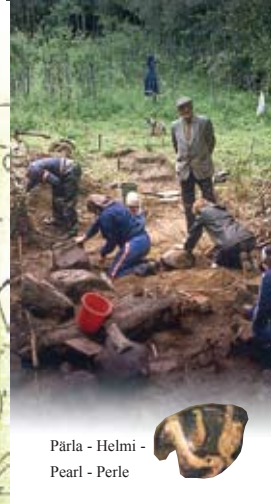
Pärä - Helmi - Pearl - Perle