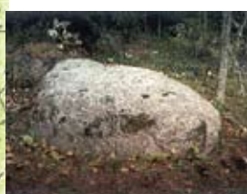
Offersten - Uhrikivi Cup stone - Opferstein