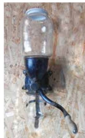
Väggekaffekvarn med kvarnhus av gjutjärn, glasbehållare upptill för kaffebönorna och undertill för det malda kaffet. Ovanlig kvarn med glasbehållare för kaffebönor. De flesta väggekvarnar har porslinsbehållare. Sven-Erik Sundbäck donerade kaffekvarnen till Brinkens museum 2016.