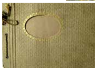
Fotoalbum från början av 1930-talet i ett enklare utförande än de äldre amerikanska albumen. Albumet innehåller svartvita amatörfotografier från åren 1933–1939. Albumets ägare har skrivit sitt flicknamn på insidan av albumet