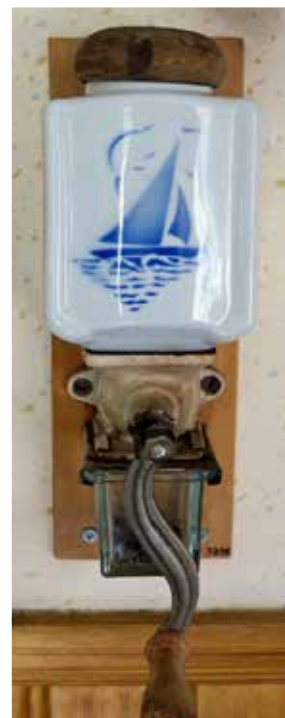
Väggekaffekvarn med porslinsbehållare för kaffebönor och glasbehållare för det malda kaffet. Kaffekvarnen finns vid Stundars museum.