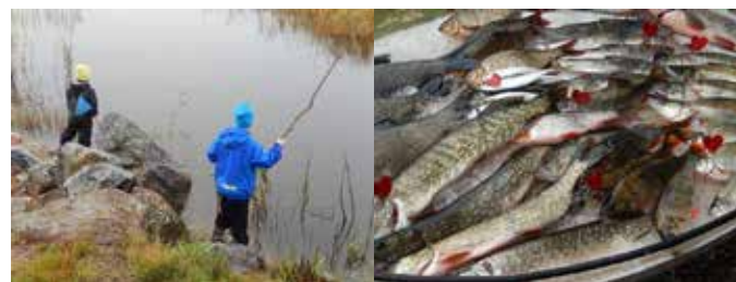
Mete och fiskkännedom lärdes bl.a. på Fiskets dag.