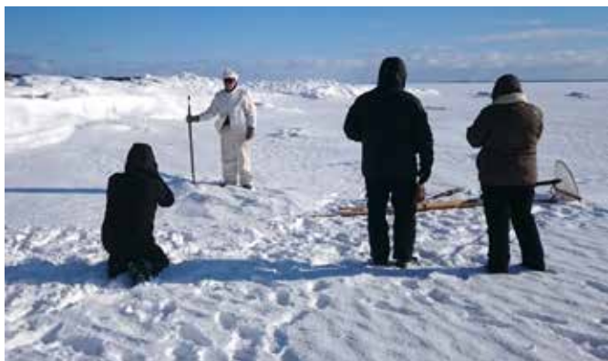
Museilotsen-projektet filmade utanför Granösunds fiskeläge i Vallgrund