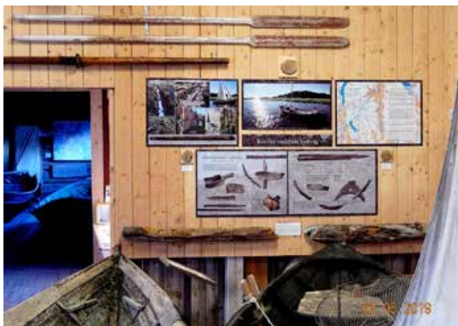
Den medeltida kyrkvägen över land och vatten från Kvevlax till Gamla Vasa visas i Långs lada, likaså rester av en medeltida båt.