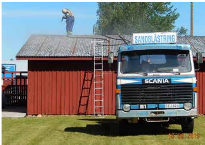
Båthallens tak sandblästrades och tvättades före målning.