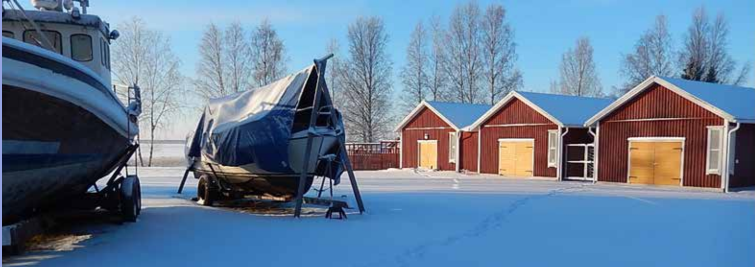
Båtar i vinterförvaring intill båtmuseets "Leaderhallar". 21 1. 2019.