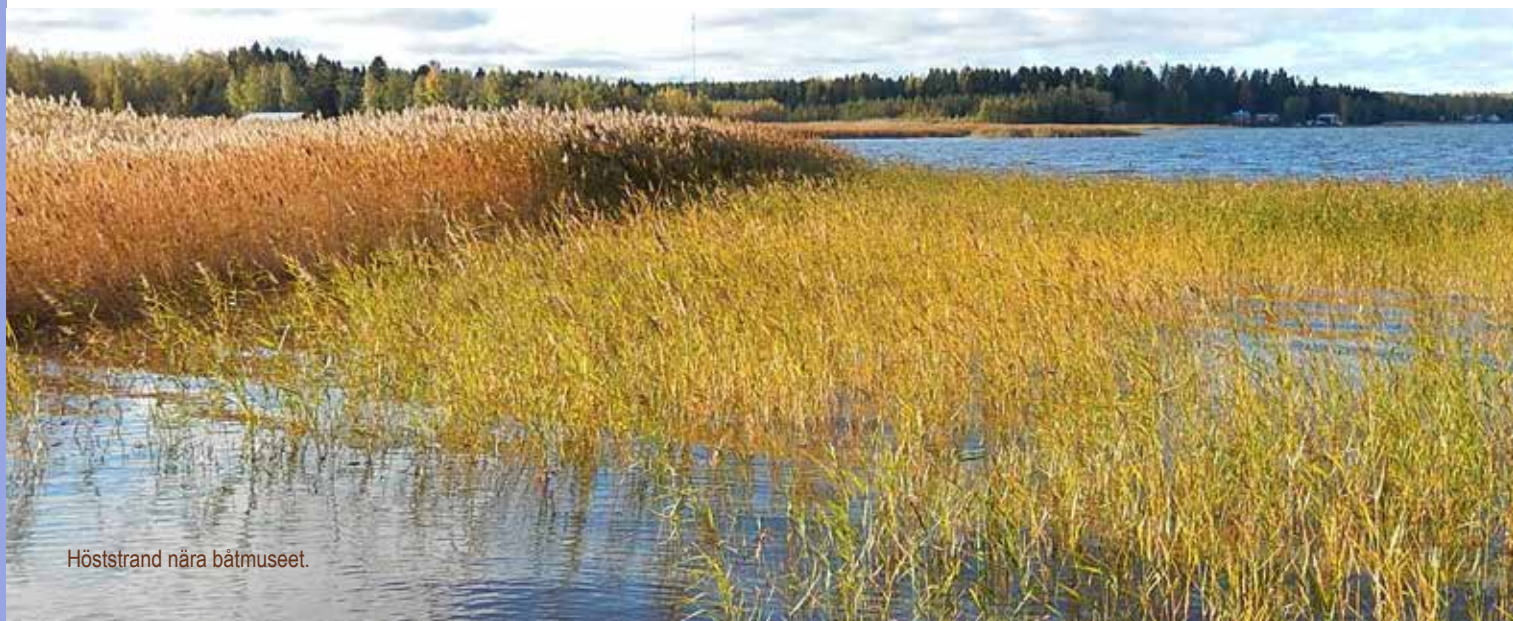
Höststrand nära båtmuseet.