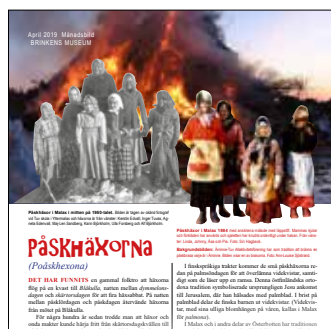
MANADSBILDER för april 2019 handlade om påskhäxor (Brinkens museum) och fartygsloggen (Kvarkens båtmuseum. Infobilderna görs i A4-format.