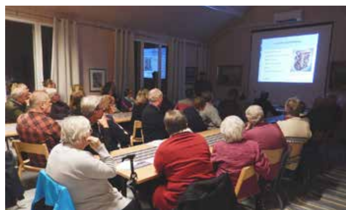
MI-föreläsningarna samlade många deltagare.