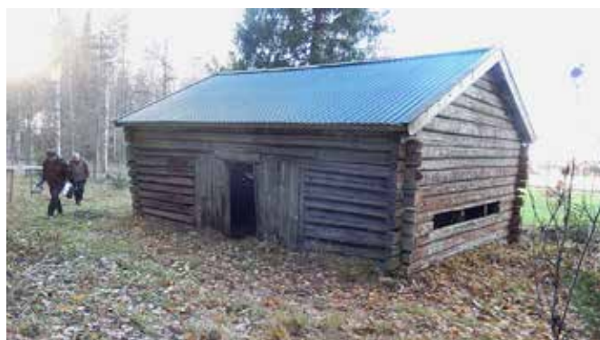
Den gamla sjudarladan invid Järnåldersleden innehåller gamla jordbruksredskap från fäbodtiden. Informationen om ladan och föremålen ska förnyas.

Det planerade arbetet med att förnya och trycka informationsstugans texter på hållbara skyltmaterial har också påbörjats. De befintliga texterna har fotograferats och överföringen till digital form har påbörjats. Förhoppningsvis kan överföringen av den resterande texten avklaras under kommande år, samt översättning till finska och engelska påbörjas. Informationsskylten vid sjudarladan har även den sett sina bästa år. Den här skylten skall göras om med mera information och översättningar till flera språk och tryckas på väderbeständigt material.