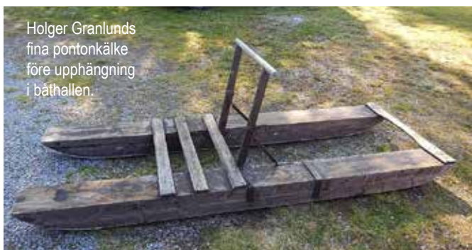
Holger Granlunds fina pontonkälke före upphängning i båthallen.