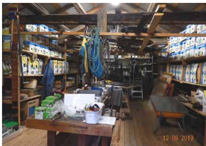
Staketbygge på gång (överst) och en titt in i näthuset, som även är verkstad.