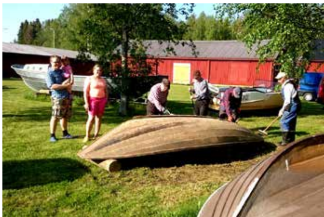
Bertil Bonns fäljulla putsades innan den tjärades.