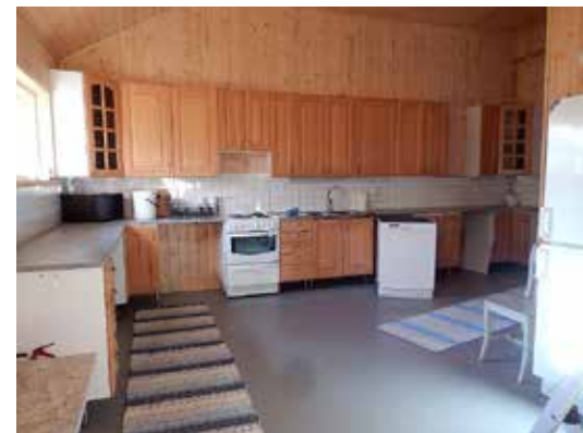
Bl.a. ett välbehövt sommarkök och två WC-utrymmen färdigställdes med de penningbidrag som erhållits.