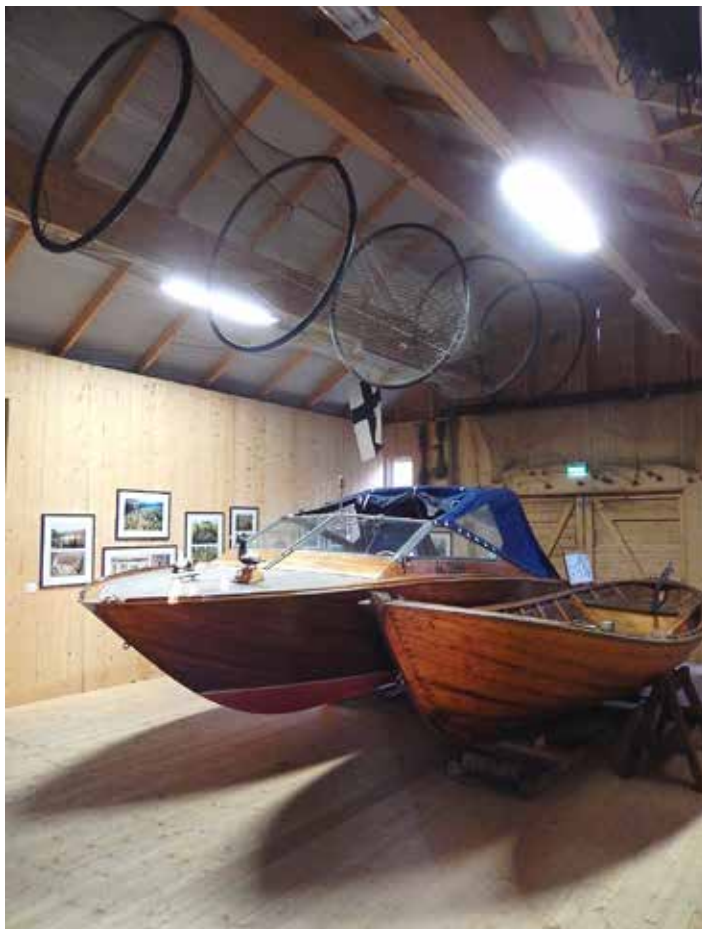
Abborr-ryssjan passar fint under södra hallens tak.