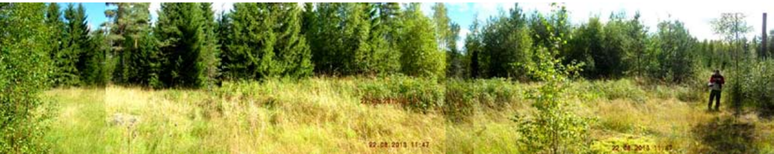
Limossen fåbodställe i Malax, "Nedre backen" (norra backen). Panorama mot ost–sydost från södra delen av fåbodbacken. Foton 23 augusti 2013 / Göran Strömfors