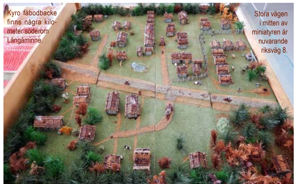
Kyro fäbodbacke finns några kilometer söderom Långåminne.

som man kunde lyfta av taket på, där man såg alla rum och möbler. Elis vävde till och med små mattor i rätt färger till de små rummen och satte in belysning som drevs med batteri. Denna modell är ca 2 x 1 meter och finns i förvar hos mig.