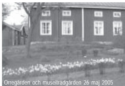
Orregården och museiträdgården 26 maj 2005