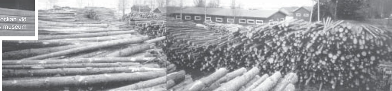
Vällingklockan vid Brinkens museum

Planen invid båtmuseet var så här rekordfylld under vårvintern (30 mars), och det mesta virket är ännu kvar. Det är däremot inte träden längst t.h. i bild: museiföreningen beslöt senaste höst att de nedtas för att förekomma vindfall på elledningarna och museibyggnader. Gemensamma skifteslaget donerade träden (virket), Vasa elektriska fällde dem gratis 16 april, och museiföreningen höll "huggtalko" 26 april (12 deltagare), brandkårens ungdomssektion bränner riset. Båtmuseet syns nu bättre, och Åminne öppnar sig ljusare än tidigare för besökaren. Välkommen!