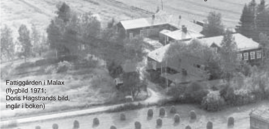
Fattiggården i Malax (flygbild 1971; ingår i boken)