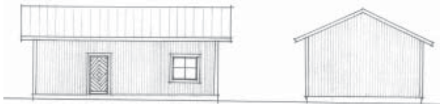
Arkivbyggnaden (10 x 6 m) sedd från söder enligt Christer Öhmans skiss. Byggnaden innehåller ett arkivrum och ett forskarrum. Arkivbyggnaden placeras mellan soldattorpet och loftsbyggnaden i norra delen av museiområdet.

Anslagen hittills förslår väl inte för mycket mer än grundarbetena, och byggnadstakten får lov att följa den takt i vilken bidrag utifrån beviljas. Men början är gjord och vi får under några år framöver med spänning följa med hur arkivbygget reser sig.