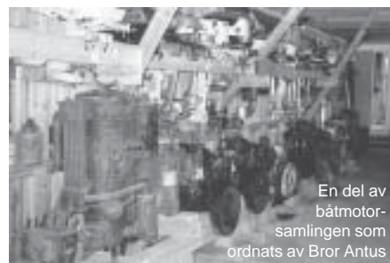
En del av båt-motorsamlingen som ordnats av Bror Antus

Underhållsarbeten med hjälp av både avlönade anställda och talkokrafter försiggick på området, och särskilt utmärkte sig den idérike och bestyrtsamme sommar-åminnebon Bror Antus med värdefulla planeringsuppslag och förbättringsinsatser.