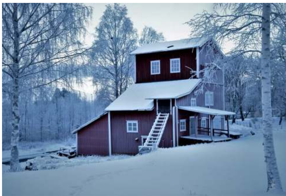
Långfors kvarn: En sovande pärla. Här i vinterskrud.