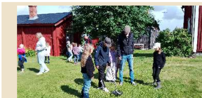
Sökning med metalldetektor på Brinken.

Det sistnämnda tyckte barnen var det mest spännande, och vi fick önskemål om ett helt arkeologiskt läger till nästa år.