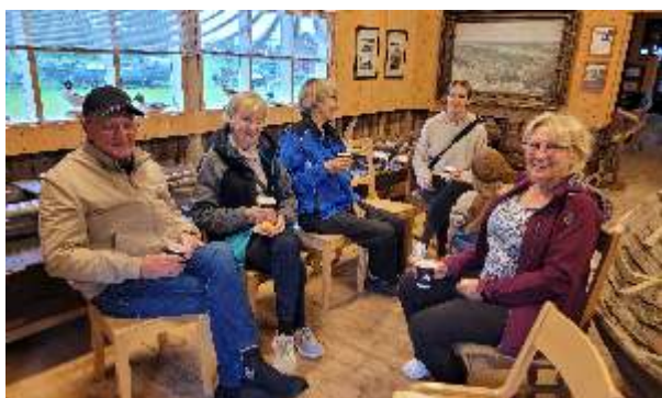
Museiföreningen deltog i Österbottens museidag den 25 augusti med öppet hus vid båtmuseet. På bilden njuter några av besökarna av kaffe med dopp i Långs lada.