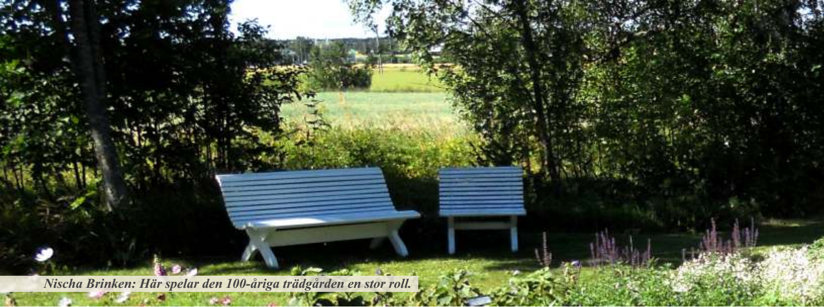
Nischa Brinken: Här spelar den 100-åriga trädgården en stor roll.