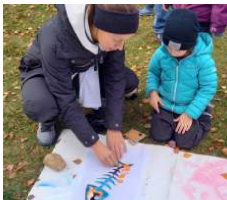
Konstnärlig aktivitet i form av T-tröja med fiskinspirerat tryck.

Barnen fick även bekanta sig med generativt vattenbruk och bland annat då dammusslor, även några barn fick provsmaka dessa delikatesser.