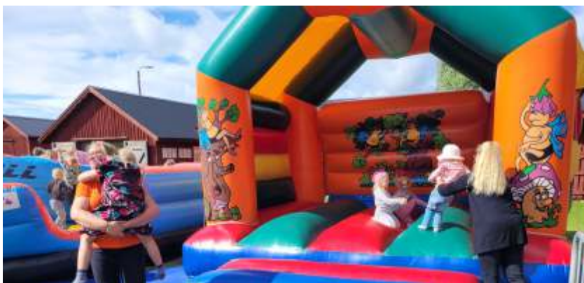
Malax kommun i samarbete med olika föreningar arrangerade Malaxdagen den 11 augusti i Aminne. Hoppborgen, som fanns vid båtmuseet, var flitigt besökt.