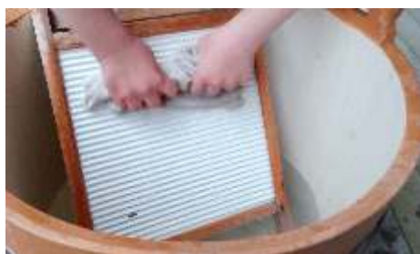
Tvätt dagen – att gnugga tvätten ren på tvättbräde var en ny erfarenhet för de flesta av barnen.

Projektledare Malax museiförening r.f.s utvecklingsprojekt 2024–2026 E-post: mmf.brinken@gmail.com Telefon: 040-813 3137