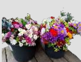
Ljuvliga blombuketter från Brinkens trädgård var till salu under sommaren.