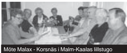
Möte Malax - Korsnäs i Malm-Kaalas lillstuga

Vid utblicken mot den närmaste framtiden konstaterades det att föreningen åtagit sig en verkligt krävande utmaning i och med planerna på ett eget arkiv för förvaring av dokument och textilier, att uppföras som ett nybygge i norra ändan av Brinken-området. Möjligheterna att genomföra projektet avgörs förstas helt av om föreningen erhåller de pengar som för ändamålet söks från olika håll, nu till att börja med från Svenska kulturfonden och Museiverket.