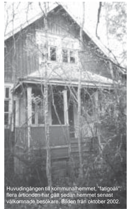
Huvudingången till kommunalhemmet, "fatigoåli": flera årtionden har gått sedan hemmet senast välkomnade besökare. Bilden från oktober 2002.

Planerandet av de arkivutrymmen som det lokalhistoriska arbetet återaktualiserat, gick under sommaren in i ett intensivare skede. Detaljer ifråga om utrymmesbehov och kostnader utreddes av en med kulturfondsmedel stödd arbetsgrupp, och med byggnadsingenjör Christer Öhmans hjälp konstaterades bl.a. att ett eget arkivbygge skulle bli både ändamålsenligare och ekonomiskt förmånligare än det närmast konkurrerande alternativet (inköp och ombyggnad av utrymmen i kommunens f.d. brandstation i Köpings).