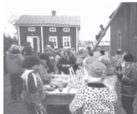
Malax-Korsnäs bildkonstskola 28.9.2002

söndagar arrangerades denna sommar för allmänheten också en större hembygdsgård med rikligt program, högsommarväder och soppottspisning för en besökarskara på hela 250 personer.