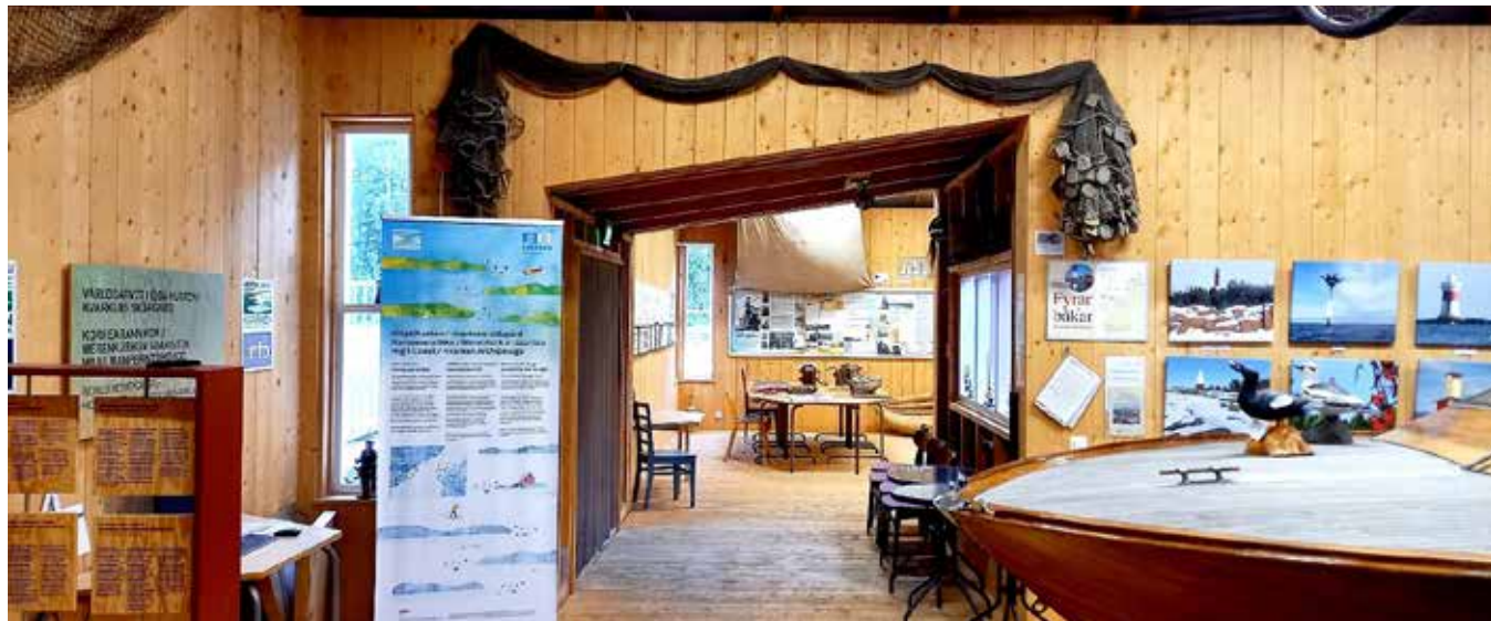
Vy från utställningshallarna.

I juni togs även en kortläsare (Zettle Reader 2) med tillhörande telefon i bruk för betalning av inträdesavgifter. En router för Internetuppkoppling har inköpts. Den behövs vid Kreativa Kvarkens infovägg.