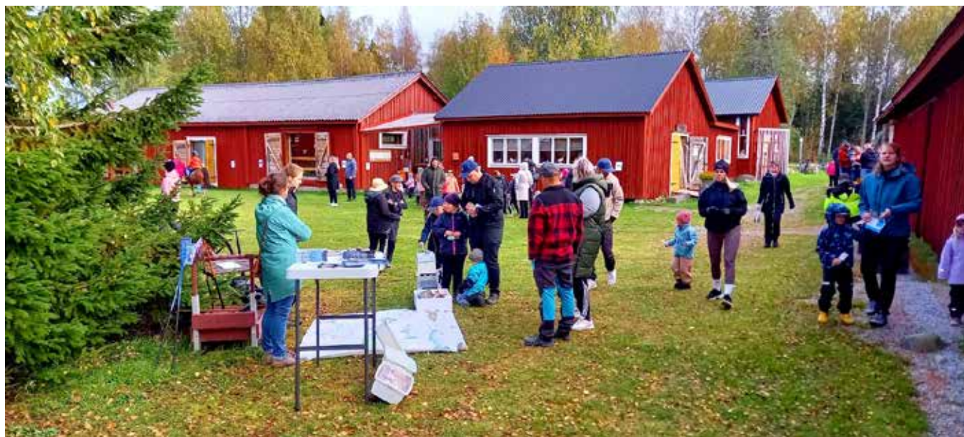
Det var liv och rörelse både ute och inne i museets 20 byggnader under Fiskets dag. I förgrunden Österbottens fiskarförbunds infopunkt med massor av informativa skrifter.

Föredrag om Stenåldersbyarna i Mellersta Österbotten hölls den 7 november av arkeolog Lauri Skantsi. Tillfället var ordnat av Österbottniska fornforskningssällskapet och 34 deltagare mötte upp.