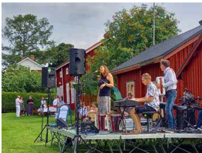
7 augusti 2023. Blommornas dag och Malaxdagen. Olika artister uppträdde hela eftermiddagen på gårdsplanen och olika aktiviteter ordnades för barn.

Blommornas dag arrangerades även detta år i samarbete med Malax kommun som samtidigt arrangerade Malaxdagen. Kommunen bjöd alla besökare på kaffe med dopp. Museiföreningen skötte det praktiska med kaffeserveringen. Olika artister uppträdde hela eftermiddagen på gårdsplanen och olika aktiviteter ordnades för barn. Museiföreningen sålde blombuketter och lotter.