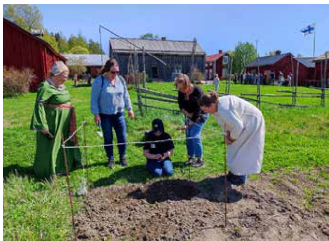
21 maj 2023. Vikingadag vid Brinkens museum. En av aktiviteterna under dagen syns på bilden – en liten arkeologisk utgrävning för barn, där de fick söka vackra pärlor i Brinkens grönsaksland.