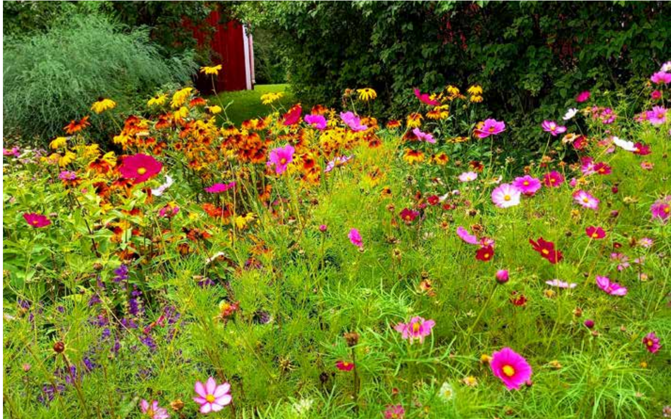
Blomster i Brinkens museiträdgård i juni 2023.