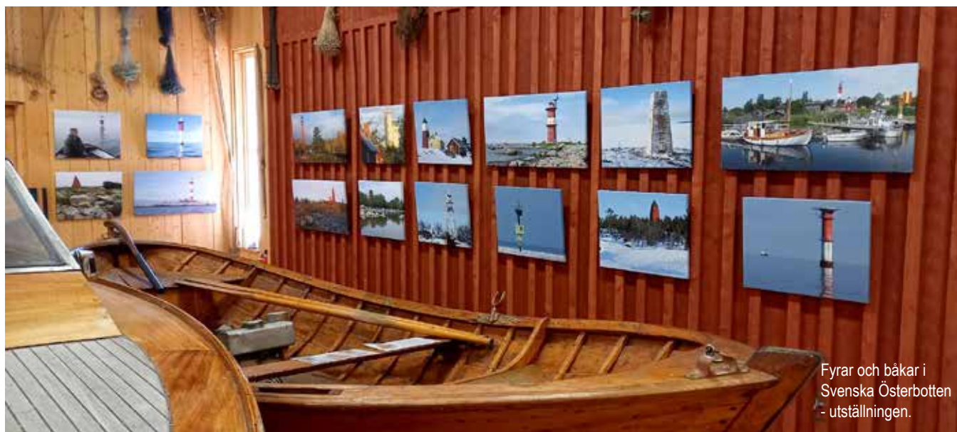
Fyror och båkar i Svenska Österbotten - utställningen.