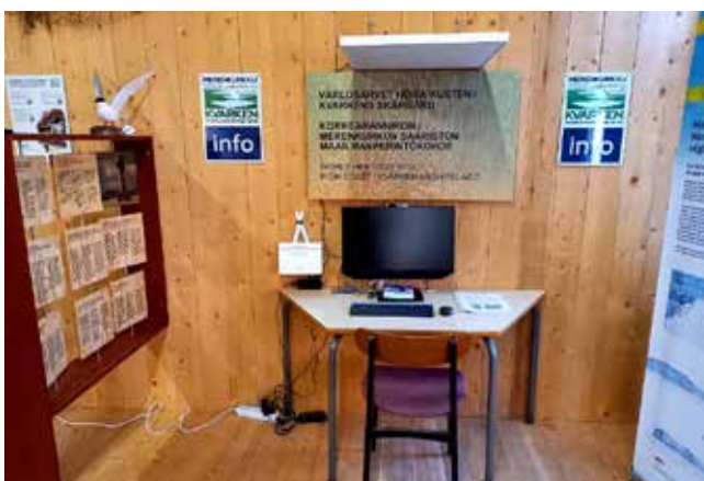
Kreativa Kvarkens infovägg blev klar i september. Halva väggen ses ovan. TV:n med ljuddusch var i flitigt bruk på Fiskets dag den 1 oktober.