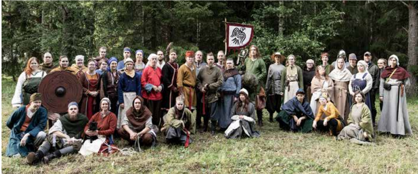
Deltagarna i Rollspelsföreningen Elorias storlajv Korpkvädet , som hölls vid Järnåldersleden i juli.