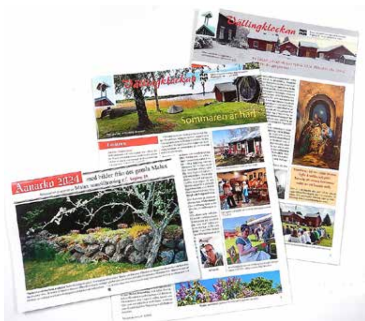
Föreningens medlemsblad Vällingklockan utkom två gånger och Aanacko 2024 utkom lagom till julhandeln.