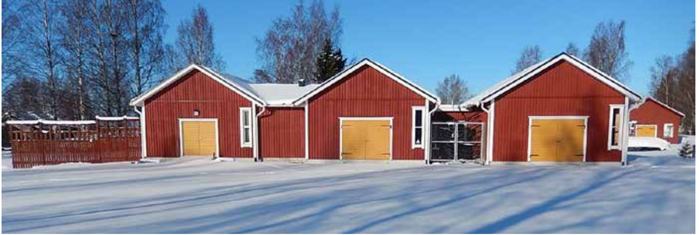
Båtmuseet från öster den 25 februari 2023.