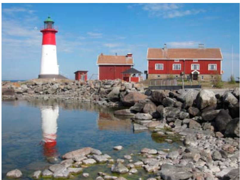
Strömmingsbådan. Bergö, Malax.

Tavelutställning i nya hallen av fotograf Hans Hästbacka. 33 tavlor visas. Utställningskatalog kan köpas.