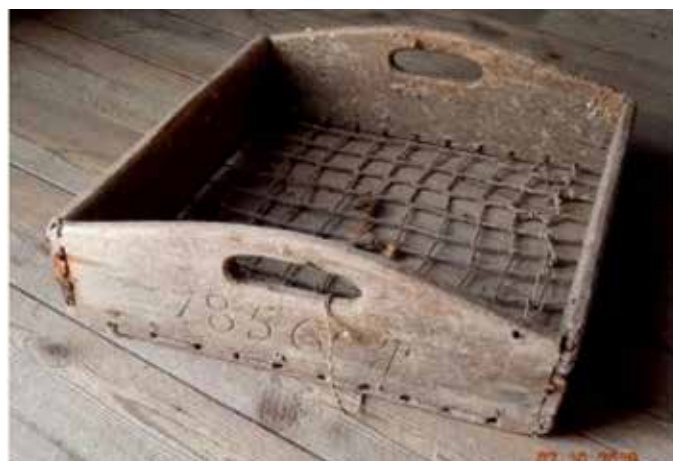
KBM-77, år 1856, 38 x 38 x 13 cm, bomärke, donator August Herlin 1971. Maska 3 x 3 (2,5–3,5) cm, snöre, cirka 18 liter.