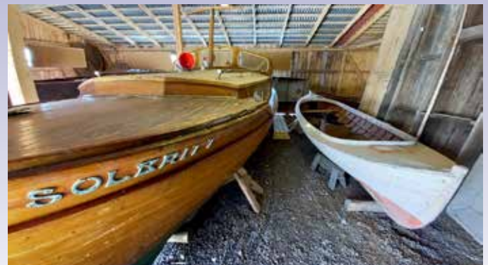
Båten SOLBRITT och Knutas boätin i båtmuseets båthall.

En förutseende båtförare stängde kranen som ledde in petroleum till förgasaren och öppnade i stället kranen som försåg förgasaren med bensin. Motorn stannade med bensin i förgasaren – och gissa om den blev villig att starta nästa gång föraren drog igång motorn! Man lär så länge man lever, men ett tydligt kännetecken som definitivt avgjorde