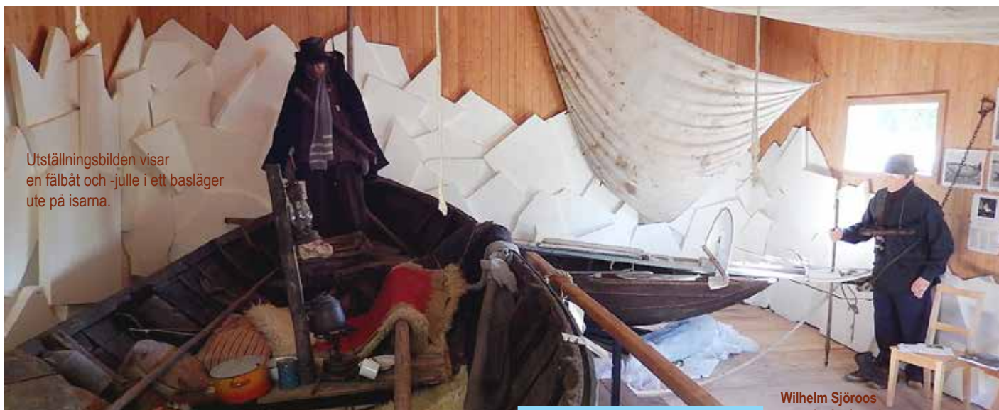
Utställningsbilden visar en fälbåt och -julle i ett basiägar ute på isarna.

Februari 2021 Månadsbild KVARKENS BÅTMUSEUM