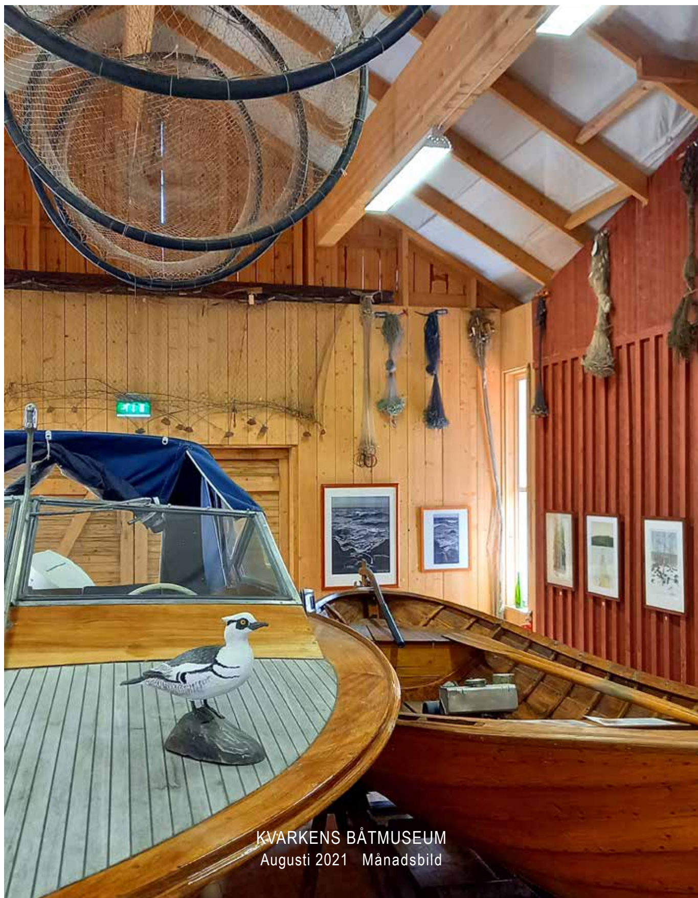
KVARKENS BÅTMUSEUM Augusti 2021 Månadsbild