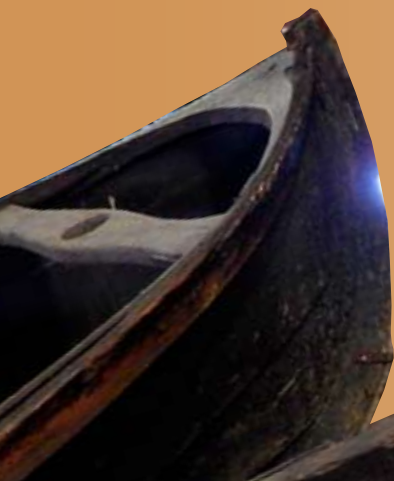
Skötbåt märkt KFB 1881. deponerad av Österbottens museum 1971