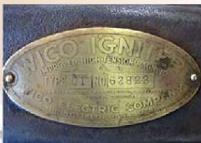
Skylten ovan hör ihop med WICO-magneten till höger. Magneten till vänster har tillhört en båtmotor i Äminne, Malax. Båda magneterna gäller för encylindriga båtmotorer.