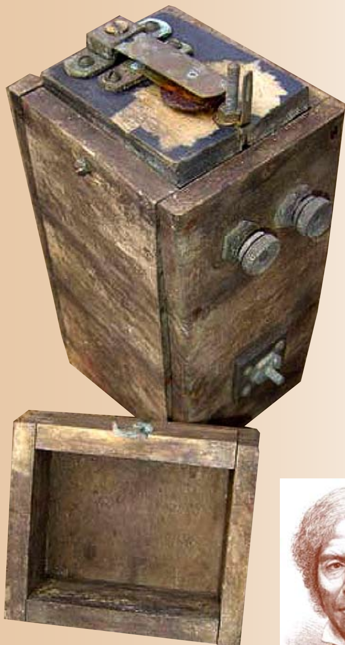
Michael Faraday (1791–1867) var en brittisk fysiker och kemist, som kom med viktiga bidrag inom elektromagnetism och elektrokemi.