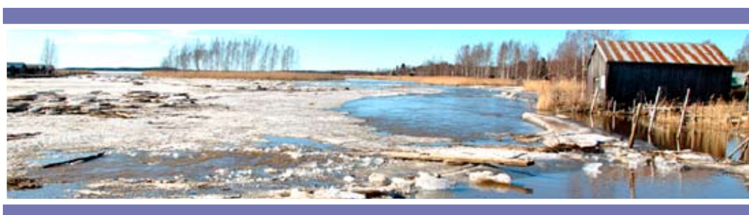
Bilderna är tagna den 19 april 2013 i Åminne.