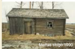
Mattas stugo 1990