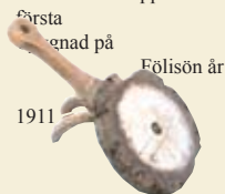
Första genad på

Malaks, skriven av Axel O. Heikel i Finskt Museum , nr 1 1904. Läs mera i boken Fåbodliv i Malax , utgiven 1987 av Aktiv närkultur. — En inredd fåbod finns vid Brinkens museum i Malax. På Fölisön i Helsingfors finns en fåbod från Limossen i Malax, uppförd som