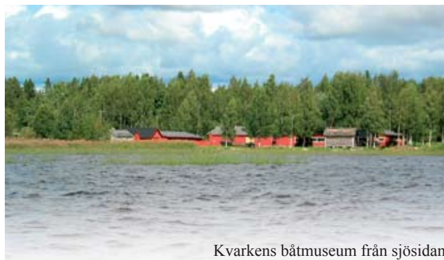
Kvarkens båtmuseum från sjösidan.