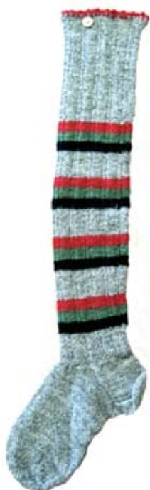
En finstrumpa för kvinnor – från 1800-talet.