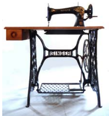
Singer symaskin, modellen tillverkades 1890–1920.