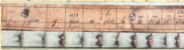
Del av den påklistrade pappersremsan. I bakgrunden alfabetiska toner ur en koralbok för psalmodikon vid Brinkens museum.