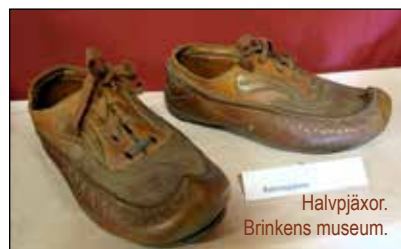
Halvpjäxor. Brinkens museum.