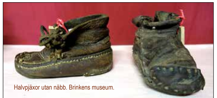
Halvpjäxor utan näbb. Brinkens museum.