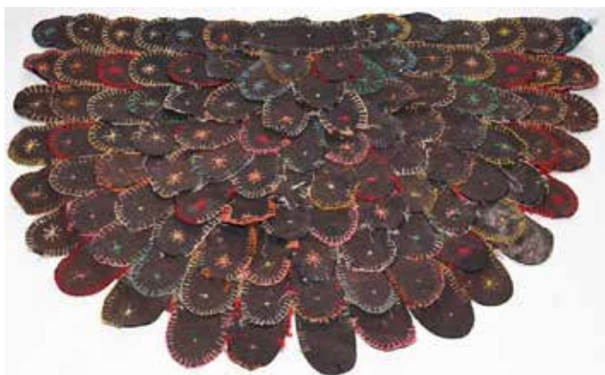
Den gamla klackmattan, som hittades i en låda i drängkammaren på vinden i Orregårdens uthus.