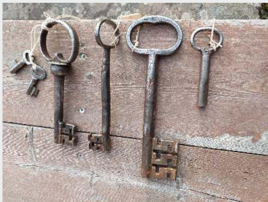
Nycklar för Kronoboden och Långfors kvarns stocklås.

Bilden till vänster: Låset har monterats in i stocken, som har fästs på insidan av dörren.