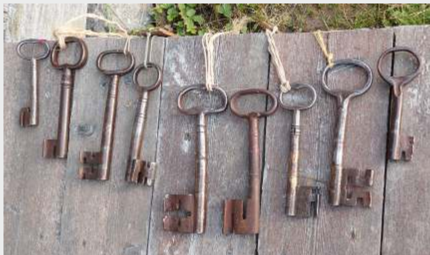
Nycklar för stocklås på Brinkens hembygdsmuseum.