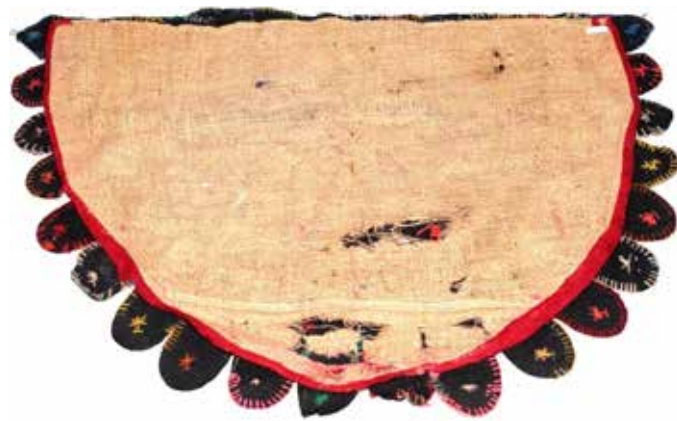
Avigsidan på Orregårdens gamla matta. Lapparna syddes förstas fast med en bordssymaskin med vevhjul och på kopian med en elektrisk symaskin.