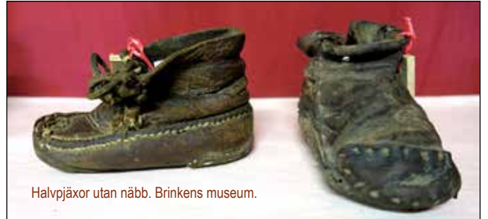
Halvpjäxor utan näbb. Brinkens museum.