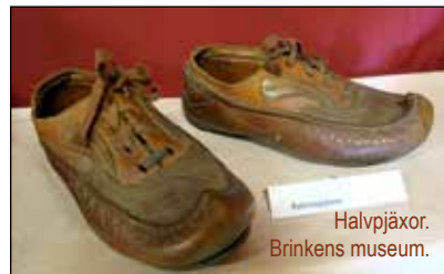
Halvpjäxor. Brinkens museum.