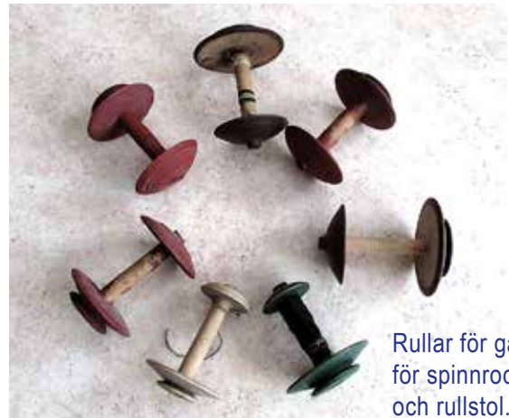
Rullar för garn för spinnrock och rullstol.