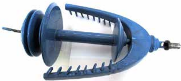
Vingspindel ( flykte ).

Se även Månadens bild November 2015: Spinrocken .