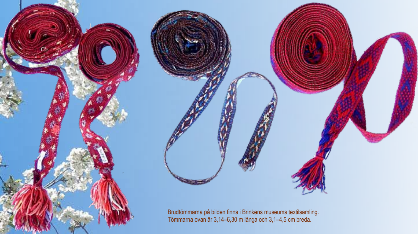
Brudtömmarna på bilden finns i Brinkens museums textilsamling. Tömmarna ovan är 3,14–6,30 m långa och 3,1–4,5 cm breda.