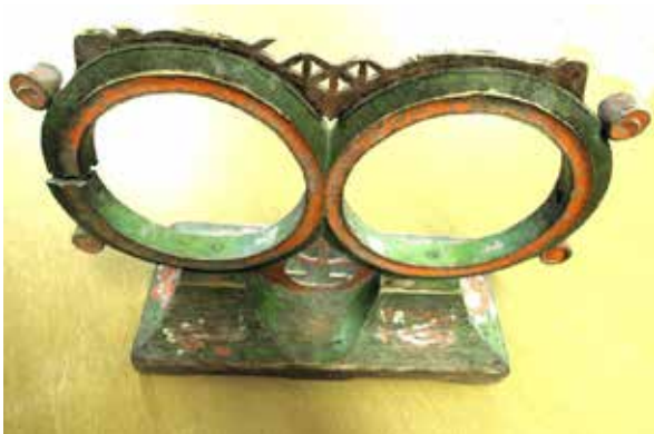
Rullstolen med två runda hål och fina dekorationer anses höra till 1700-talet och var fästmansgåva. Även sedd underifrån.