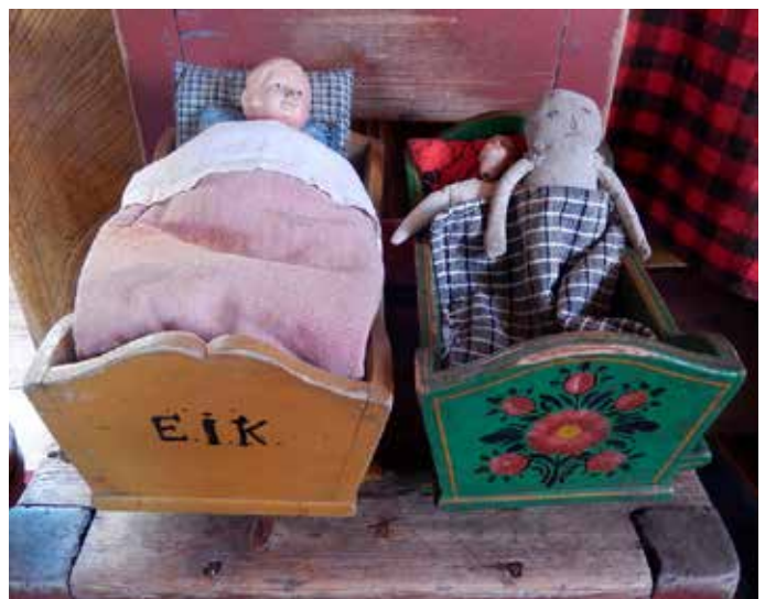
Tre dockor sover i sina små dockvagnar i Tufvasgården vid Brinkens museum.