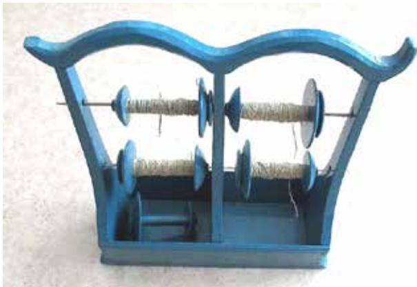
Rullstol för fyra rullar, från 1800-talet. Ommålad.