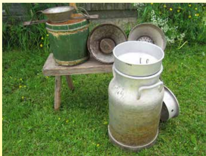
Mjölksilar av bleckplåt och aluminium vid Brinkens museum.