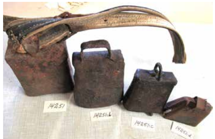
Koskällor och färicklockor.