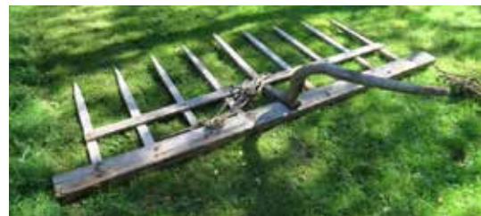
Träsläpräfsa (höbock) med ett enkelt styrhandtag gjord av en naturvuxen trädgren.

Isaks höbock har dubbla styrståndare fastsatt i släpbommen och mellan dem ett bräde. Det var ett vanligt utförande på trähöbockarna i Malax. Fotografi från mitten av 1930-talet.