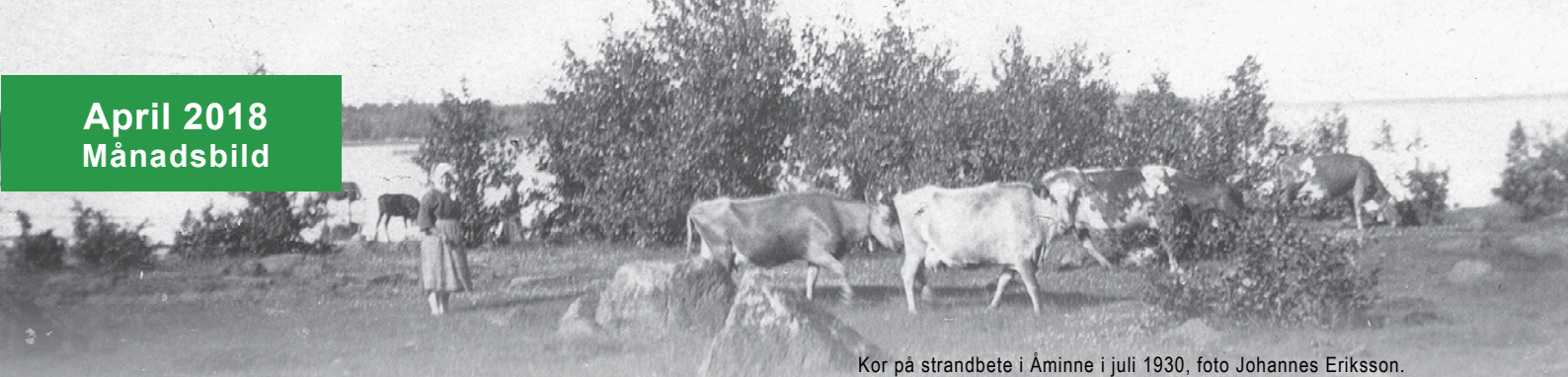
Kor på strandbete i Åminne i juli 1930, foto Johannes Eriksson.