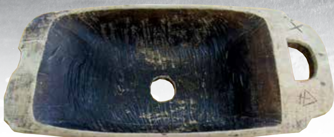
Mjölksil med inskuret bomärke från Tufvas hemman i Yttermalax. Längd 49,5 cm, bredd 24,5 cm. Brinkens museum. Bomärket på mjölksilen har använts av Jacob Tuuf (1761), Jakob Mårtensson Tuuf (1823) och Matts Abrahamsson Tuf (1909). Urtaget till höger är avsett för upphängning av mjölksilen. – Mjölksilens undre sida.