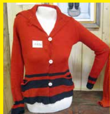
Fyra maskinstickade plagg: från vänster en underkjol, damunderbyxor, en undertröja som användes av kvinnor, män och barn samt en sjakett. Bilderna är från en utställning vid Brinkens museum år 2014.