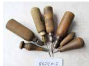
Skomakarens viktigaste verktyg var sylar, prylar, knivar, tänger, hammare och rasp samt läster av trä runt vilken skon formades och syddes. Prylar har en kantig form på spetsen. Sylar har runda och vassa spetsar. De användes för håltagning i lädret.