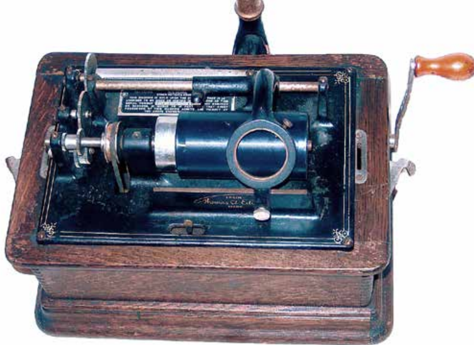
Fonografen som finns i Brinkens museum är sannolikt en "Edison Standard Phonograph, Type D", en typ av fonograf som tillverkades 1908–1911.