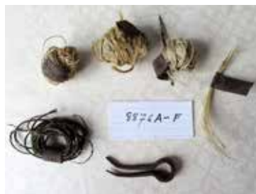
Alla delar till pjäxor och skor syddes ihop för hand med becktråd. Becktråd är en tvinnad lingarnstråd som skomakaren gned in med beck för att sömmen skulle bli stark och skydda mot väta. En svinborst fasttvinnad i becktrådens båda ändar fungerade som synål.