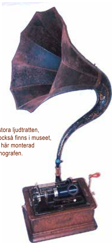
Den stora ljudtratten, som också finns i museet, visas här monterad på fonografen.