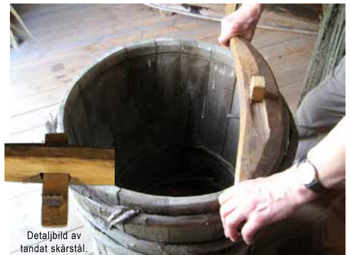
Detaljbild av tandat skärstål.

Med denna andra typ av laggstråk med ett tandat skärstål kunde spåret (laggen) skäras färdig med en gång. Träkilens läge på detta laggstråk kan ändras för att få ett lämpligt avstånd mellan laggen och kärlets öppning. Det här laggstråket skulle också vridas runt kärlets öppning ett antal gånger tills spåret fick rätt djup för inpassning av kärlets botten. Bilden nedan visar samma laggstråk som i bilden ovan.