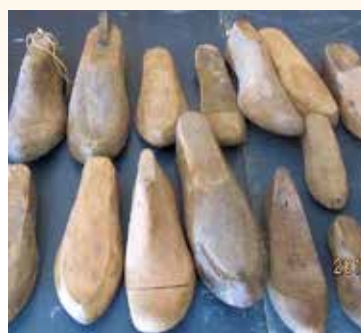
En samling skoläster i museet. Lästerna är fotformade trästycken av olika storlekar och modeller som skomakarna använde för att få rätt form och storlek på de skor som de tillverkade.