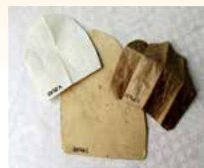
Skomakarens mallar (mönster) till sulor och klackar.