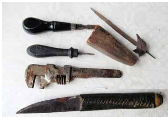
Bilden nedan: Skomakaren skar till lädret med tillskärarkniven och sulornas kanter jämnades av med skomakarkniven. ” Vitsiendo ” och den trekantiga filen på bilden behövdes för att vässa knivar och sylar.