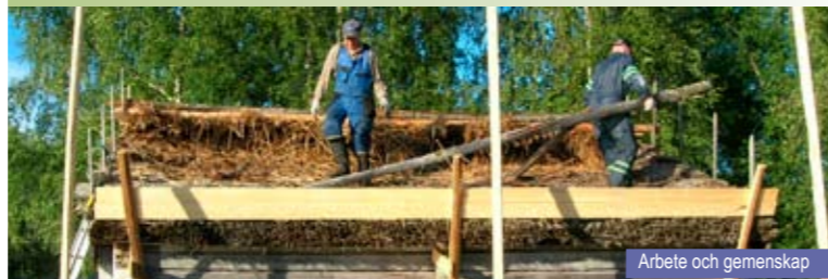
Arbete och gemenskap

Från vår till höst: talko varje måndagskväll vid Brinkens museum, varje torsdagskväll vid Kvarkens båtmuseum. På övriga platser enligt behov. Årligen arrangeras Båtens dag (juni), Vandringsled vid Järnåldersleden (juni), Hembygdsdag (juli), Blommornas dag (augusti), Dagen för Europas byggnadsarv (september)