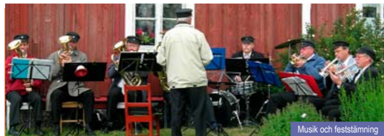
Musik och feststämning