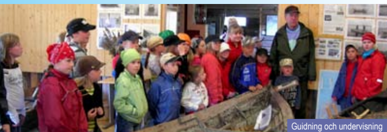
Guidning och undervisning