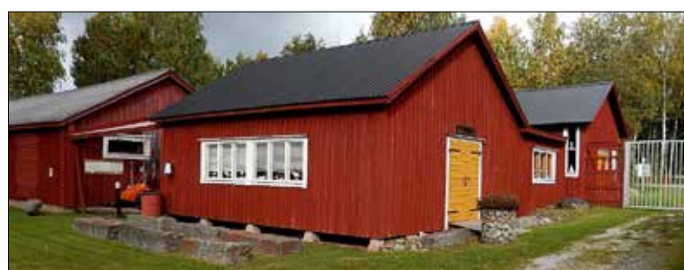
Längs lada revs i Storsjön 2002 och färdigställdes på talko vid Kvarkens båtmuseum 2004.