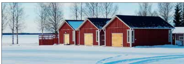
Genom ett Leader-projekt 2012–2013 byggdes fr.v. en samlingssal med kök och WC, samt två stora utställningshallar vid Kvarkens båtmuseum.