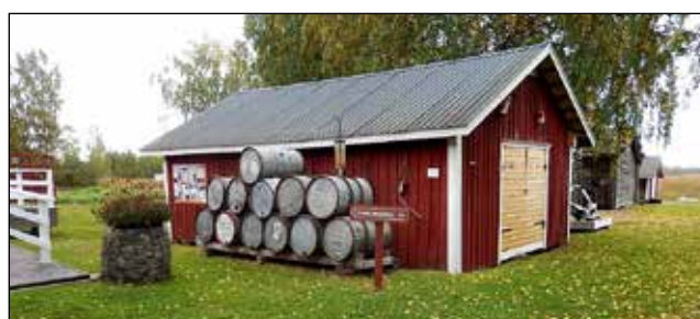
Nätuset vid Kvarkens båtmuseum har byggts på talko 1989–90 av två rivna lador i Pöle.