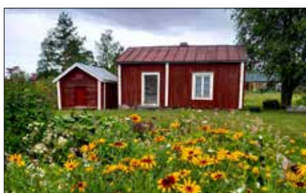
Soldattorpets bod vid Brinkens museum. I förgrunden fjärlsträdgården.

6 Eino Leino-dagen, diktens och sommarens dag 23 Röt månaden börjar 27 Sjusovardagen