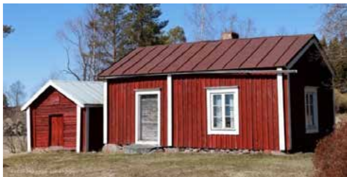
Soldattorpet vid Brinkens museum.

DE ENSTAKA SOLDATTORP som ännu finns kvar i Österbotten och övriga landskap vårdas idag av musei- och hembygdsföreningar som minnen från de indelta soldaternas tid och liv 1732–1809.