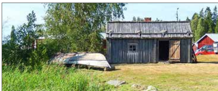
Fiskarstugan vid Kvarkens båtmuseum har flyttats och uppförts på talko åren 1993–1996.