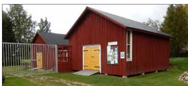
Herrgårds lada revs i Tuvas 2005 och färdigställdes 2007 på talko vid Kvarkens båtmuseum.