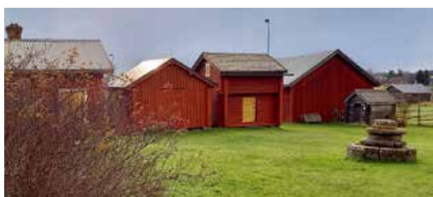
Brinkens museum med snickarboden längst t.v., mangelboden, härbret, prästgårdsldan och stockhynscho.

Rullformning av plåt, exenterpresslinjer, svets-avdelning. Ex. på produkter: skjutdörrsystem, kabeldragningskenor, cykelskärmar, stag, tråd-böckning. Mera information från vår webbsida: www.procons.fi