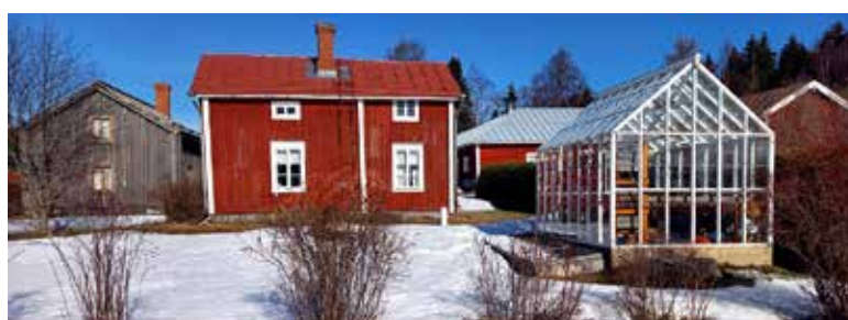
Brinkens museum. T.v. Tuvgården, Malm-Kaalas, växthuset och Orregårdens uthus.