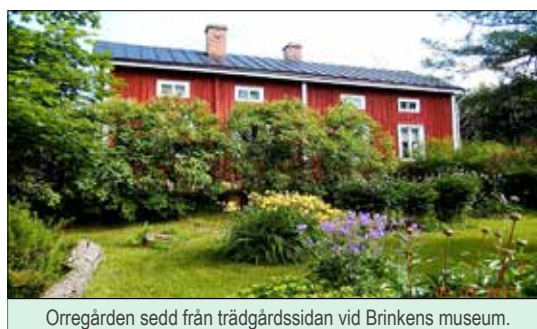
Orregården sedd från trädgårdssidan vid Brinkens museum.