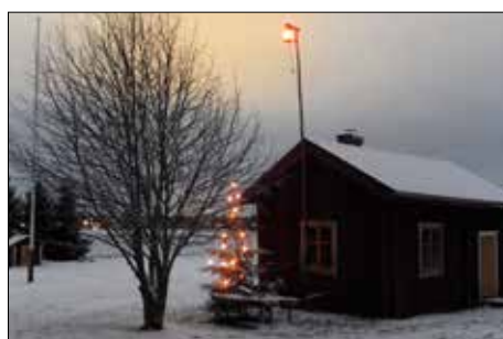
Utejulgran och jullykta vid Brinkens museum.