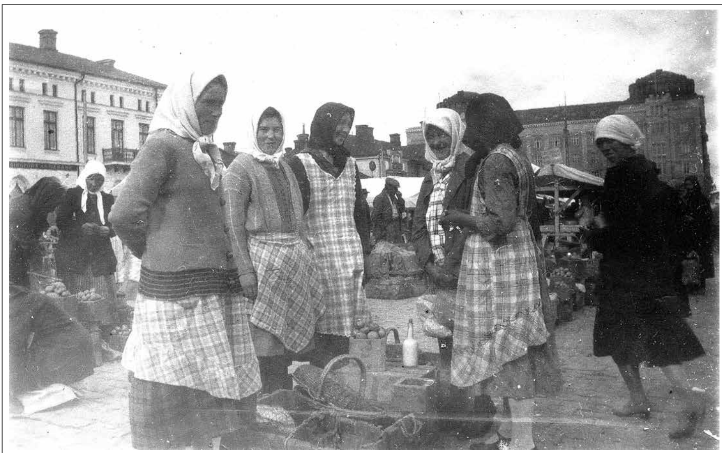
Torghandel 1926. Är det priserna som diskuteras på Vasa torg av fem glada torgmadamner? Eller kanske höstens skörd, potatisen ser fin ut. Hartmans hus ses i bakgrunden. Rutiga förkläden för tankarna till 1920-talet. Kvinnorna bakom bordet är förmodligen från Holmöns i Yttermalax.