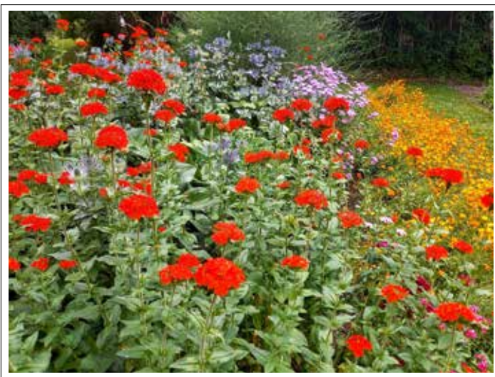
Orregårdens trädgård vid Brinkens museum, 10.7.2022.