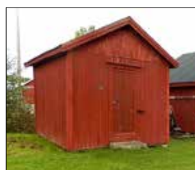
Flottningskjulet vid Kvarkens båtmuseum har flyttats och uppförts på talko åren 2006–2007.