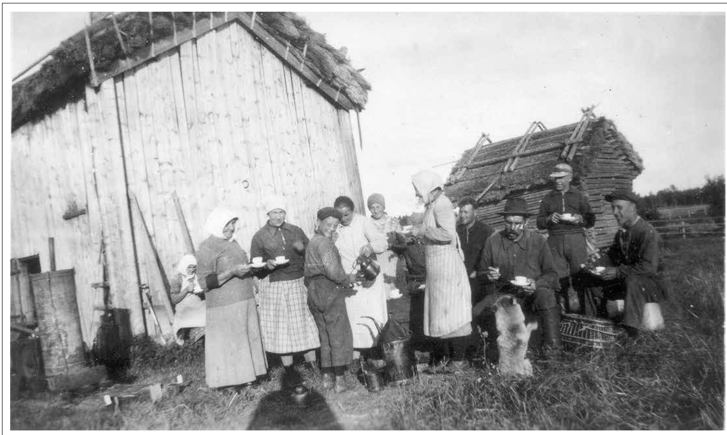
Tröskankalas hos Holméns/Hagmans vid Kaasas omkring 1926. Aldrig smakar kaffet bättre än vid en paus i svettigt och dammig tröskningsarbete. Husmor har kommit med den typiska förningskorgen (till höger framför männen). Hon har med sig kaffekoppar och fat och kaffe i kopparpannor. Lägga märke till de tjocka halmtaken på rian och ladan.