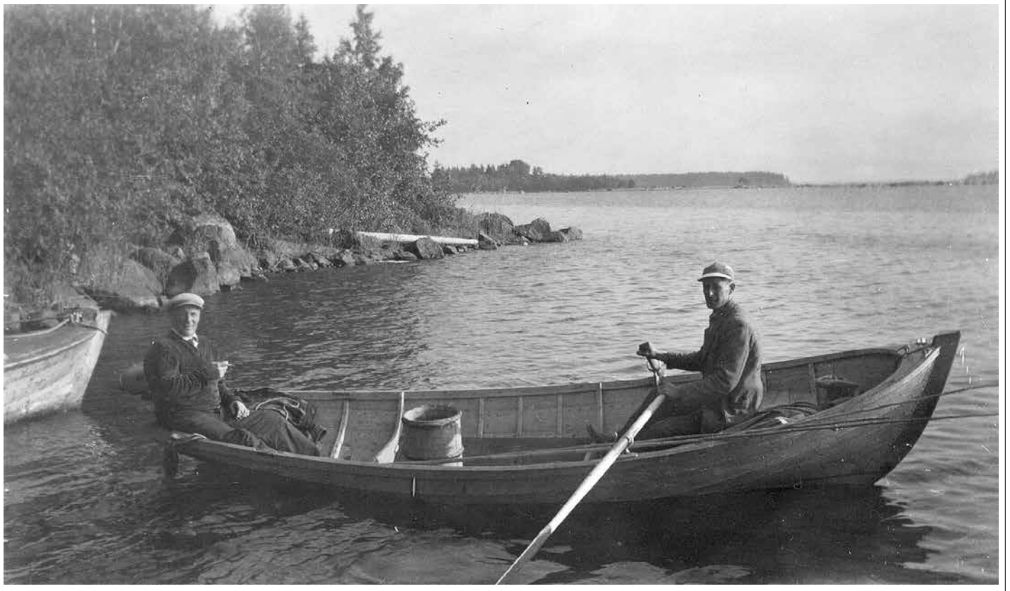
Två män i roddbåt. En vacker men mulen sommarkväll kan man försöka narra fiskarna att nappa på kroken. Två långa bambumetspön ligger i båten. Kanske det också lönar sig att lägga nät, nätitånno är i alla fall med. – Okänd fotograf. Malax museiförening; skannad 2001 från Ann-Mari Stolpes bild (MM-15).